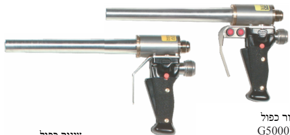
צינור כפול G5000