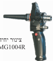
צינור יחיד MG1004R