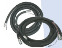
סט צינור יחיד וסט צינור כפול