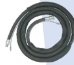
סט צינור יחיד