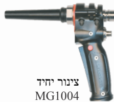
צינור יחיד MG1004